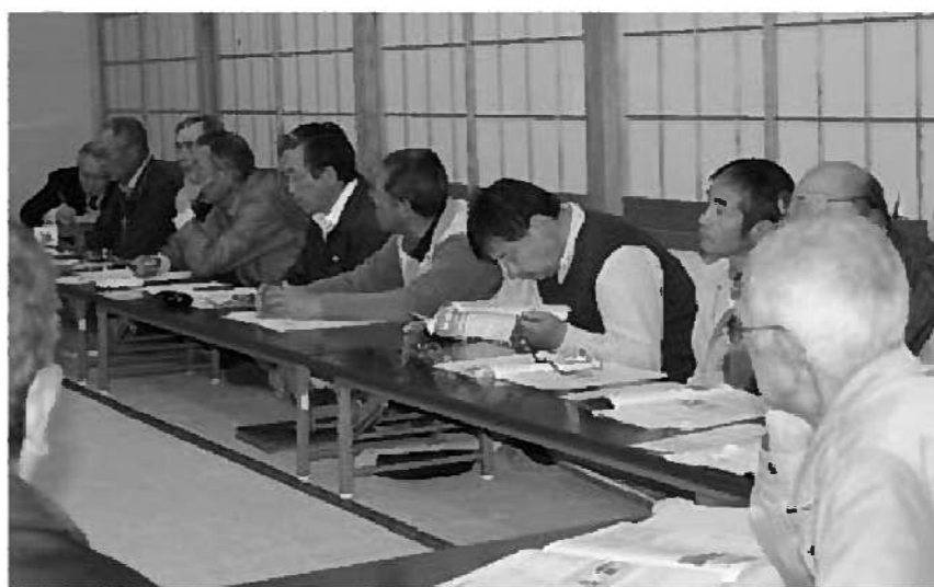
リニアに関する意見が多く出された壬生沢会場

議会では、議会改革の一環として、各地区へ出向き村民の皆さんと議会の意見交換の場として「議会とむらづくりを語る会」を、4月26日から5月20日までの間、村内9地区9会場で開催しました。出席者は合計176人(内、女性12人)でした。出された意見や要望には、それぞれの地域色の見て取れるものの他、多く出されたものには戸建住宅に関するもの、リニア関連の不安に対するもの、区や自治会の行政負担の問題などがあり、議会に課せられたものも少なくありませんでした。議会には、多くの諸課題解決のため、一層の努力が求められた「語る会」でした。尚、各会場から出された意見・要望は6ページから10ページに掲載してあります。