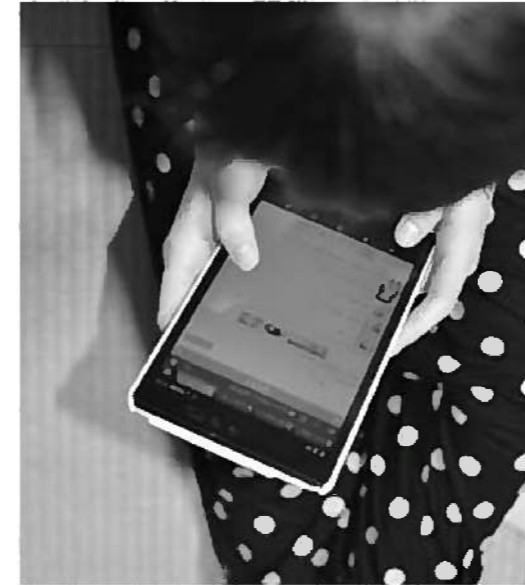
ネットに依りすぎていませんか？

えている。 質問 村の子どもたちの健康状態は。 子ども課長 外遊びや運動が減り、血液検査で脂質異常や高血糖を示す子どもも見受けられ、生活リズム改善等、保護者と共に改善をしている。 質問 4月に発足した「子ども課」と「健康福祉課」の連携は。学校や地域との連携は。 子ども課長 乳幼児健診に子育て相談員が参加するなど、日常的な連携ができています。生活リズム改善運動は、教育委員会を中心に、保健師、子育て支援員、保育園、小中学校、PTAが連携して展開している。 教育長 うまく歩み始めている。特に生活リズム改善運動は、24年度に文部科学大臣表彰を受賞し、テレビ等でも紹介されている。