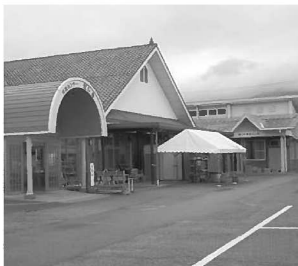
新法人に移行予定のだいち・加工組合

質問 6次産業化事業の一環とする「道の駅」計画が、向こう3年間の実施計画に乗っている。この計画は3月議会に突然に示されたものだが、次の点について質問する。①中核法人設立の現状と村の関わりは②現在あるNPOだいちと加工組合はどうするか③道の駅の建設資金計画は④道の駅事業の収支計画は。産業建設課長 ①現在、2つのNPO法人を中心に検討中、新法