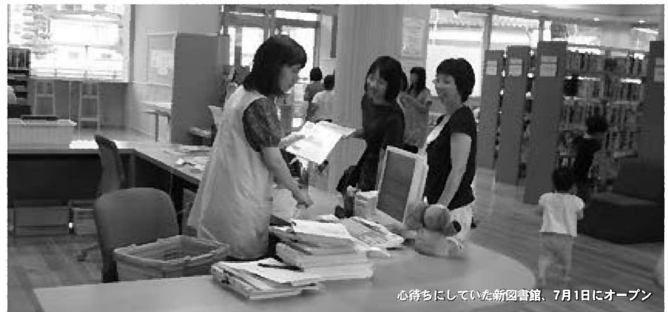
心待ちにしていた新図書館、7月1日にオープン