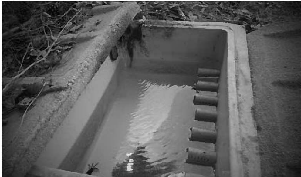
福島的生活と密着している湧水

質問 福島地域は多くの湧水があり、現在も生活に農業に利用している。リニアのトンネルで湧水が枯れる心配がある。村はどのような対応を考えているか。