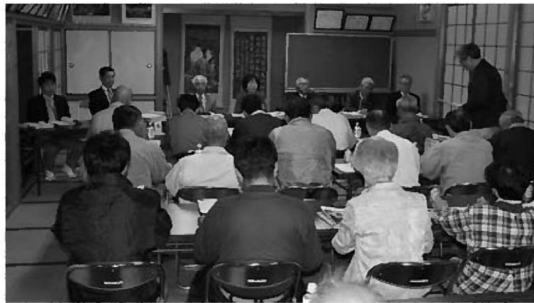
議会と語る会 福島会場

質問 区や地域の、行政から依頼を受ける実務作業は近年増加している。その内容も多岐にわたり、行政は区へ依存しすぎではないかとの声も多い。 一方、区や地域にあっては人口減と高齢化の中で、財政的負担の増や賦役でまかなわれる地域の整備事業執行に大きな課題を投げかけていると同時に、地域コミュニティの崩壊の危惧も感じている。村の認識と今後の取り組み施策を伺う。 村長 山間部は、非常に苦しい状況の中で、地域をしっかりと守っていただいております。敬意を表している。 また、こういった地域では、危機意識も強く、地域活動もしっかりとやっていたり、敬意を表している。 現行の戸当たり一百万の補助金や、条件付きでない新たな交付金制