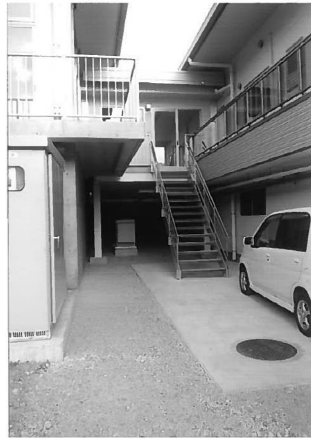
新図書館駐車場奥のスペース

質問 新図書館の下階部や西側の広場の利用目的は何か。 教育長 図書館の閉架書庫・資料館の収蔵庫・リサイクルステーション・駐車場・非常用発電装置などの場所として使用をする。 質問 駐車場については、何台位の予定と白線引きはするのか。 教育長 約10台位とし、線引きも行う。