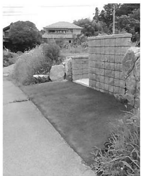
道路敷の占用箇所

質問 いわゆる赤線(認定外道路)の占用についても単価が高額である。中段地帯の傾斜地の現在使われていない赤線でも、用途が材料置場であれば近隣宅地の固定資産税評価額が適用になる。これらは近接の類似土地の評価額を基準にして決めるべきではないか。また、使われていない赤線の払い下げ単価はどのようにになっているか。産業建設課長 ひとつひとつの事例を吟味して、今後改正が必要であれば考えていきたい。払い下げ単価は公共用地取得標準表を適用し、宅地についてはその7割として若干引き下げている。