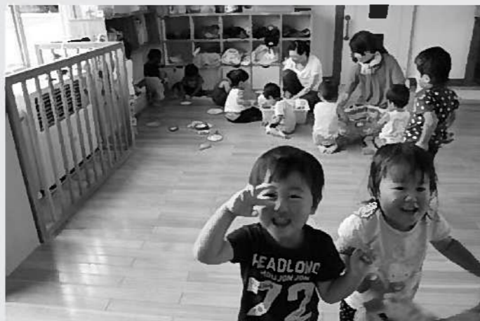
元気な「つくし」さん

答 弁 増築を考えているが、農地法の手続きが必要のため26年度はできない。よって、超過分については村内の他保育園を利用する方向で保護者と相談する。