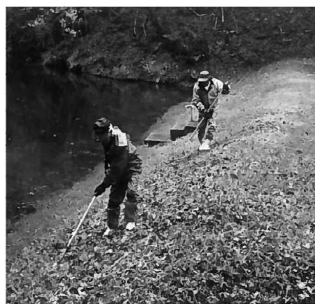
用水池での草刈りの作業

10名にする。委員報酬は職務の的確な遂行にふさわしいものとする。又、遊休農地に対しては市町村長に職務発動を、農業委員会が促す仕組みをつくる。違反転用の場合は農水大臣、都道府県知事に職権発動を促す仕組みをつくらせられている。いずれにしても農業のよりよい発展と持続できる仕組みを期待したい。