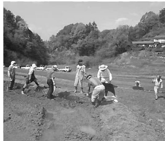
棚田オーナー制度に取り組む農業委員

質問 政府の諮問会議である「規制改革会議 農業ワーキンググループ」はこの程、農業改革に関する意見書を発表した。この中身は農業委員会の公選制の廃止と定数の大幅削減、JA全中の廃止、企業の農地所有の解禁等これまでの農業や農政のあり方を根底から覆すもので、強い批判の声があがっている。 この意見書に対する