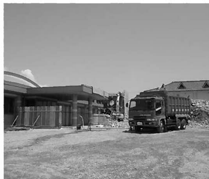
急ピッチで進む「ゆめあるて」の周辺整備

本改定案は、総務産建委員会へ付託されましたが、例年通り社会文教委員会との連合審査を行いました。審査の中では、国保税が6年連続で引上げられていることから、医療費見込みをもう少し低く見込めば据え置きが可能ではとの意見、一方基金の約8割、4千万円を取り崩す予算では将来のために引上げは止むを得ないとの意見もあり、最終的には原案が可決され、直後に再開された本会議でも全会一致承認されました。