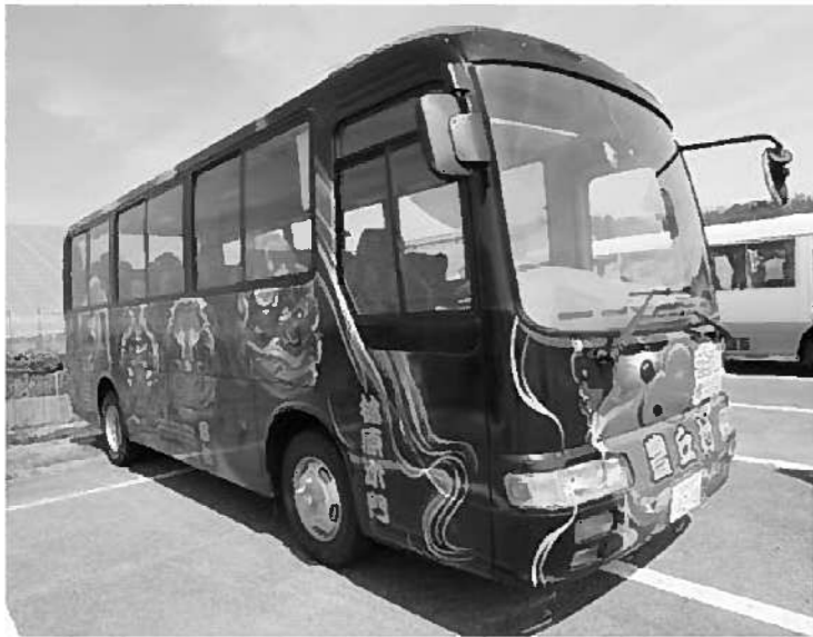
ラッピングバス(獅子バス)

いうことで行った。最終的に県と協議をした。審査の結果ラッピングにだんQくんの表示が、獅子バスには何も付いていないので、申請を遠慮、辞退してこの事業は補助申請を廃止した。 質問 補助金が出ず一般財源から拠出され行政の事務的な対応の大きな間違いであること指摘する。 もう一つ、事業の説明欄に村のイメージキャラクターである、だんQくんを使い、村内小中生がデザインしたラッピングをとりながら、村(役場)のプロジェクトでやるということはこの場合は県に対しての背信行為と思う。考えを問う。 村長 非常に稚拙な間違いだった。