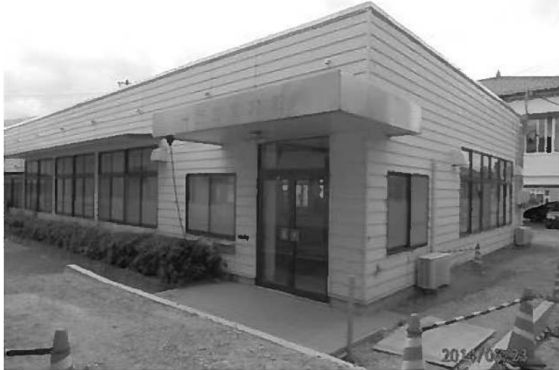
いくつかの機関が入る旧図書館

後、関係者と再協議を行う。 大原議員 ボランティアアセンタ―も入るといいうが、配食サービスはどうなるか。ここでやると人の出入りが多いので、入口は別途必要ではないか。 総務課長 今後、再協議を行っていく。