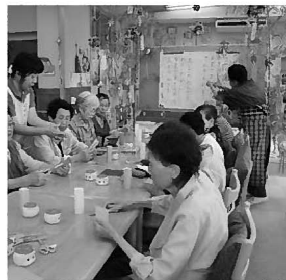
はつらつデイサービス七夕飾りのようす

とを誇りとし、自信をもって活動している。公選制を維持すべきと思っている。 質問 意見書は、農業委員会の主要な任務の一つである行政への「建議書」についても法律から削除しようとしている。豊丘村農業委員会のこれまでの建議書の中で、農業振興に寄与してきた事例はどうか。また、建議書の廃止についての見解は。 産業建設課長 主な活用事例は、有害鳥獣対策、学校給食への地元農産物の供給、遊休農地解消対策、市田柿ブランド維持対策等がある。 農業委員会長 本年も11月に建議を予定している。 農業委員会の権利である建議をなくすことのないようお願いしたい。