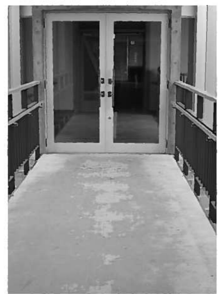
保健センター2階入口の廊下

総務課の管理であり直す予定の物もあつたと思うが、今後は報告・相談などはつきりさせて行く。 質問 自らつくる地域づくりや、コミュニティ事業の助成金とは違う意味合いの、その地域が存続して行くため自由に使える交付金制度の設立が必要では。 村長 自治会の自治を尊重しながら考えても良いと思う。