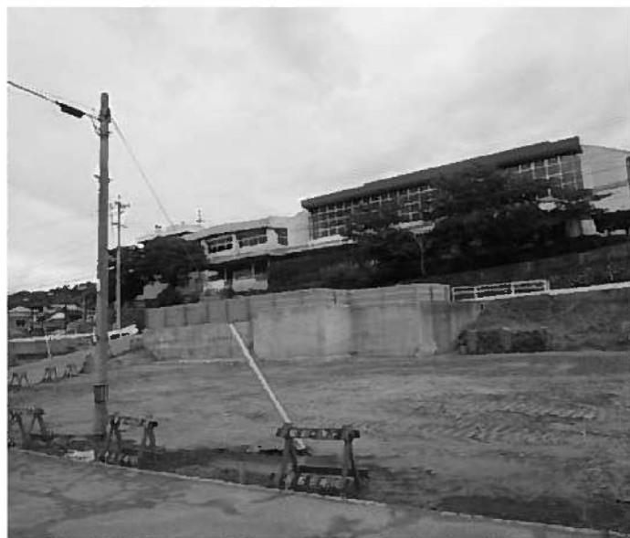
河野児童クラブ建設予定地（県道下）

答 事務方の手続き不備 質問 3月議会で私の質問に、片内のプロジェクトで、だんQくんは知れ渡ったから、村内の獅子にして、県の支援金で作ったと報告があった。3月末の全員協議会では、支援金は賈えず村費との報告。バスは2月から走っていたので、3月議会に 答 事務方の手続き不備 質問 3月議会で私の質問に、片内のプロジェクトで、だんQくんは知れ渡ったから、村内の獅子にして、県の支援金で作ったと報告があった。3月末の全員協議会では、支援金は賈えず村費との報告。バスは2月から走っていたので、3月議会に