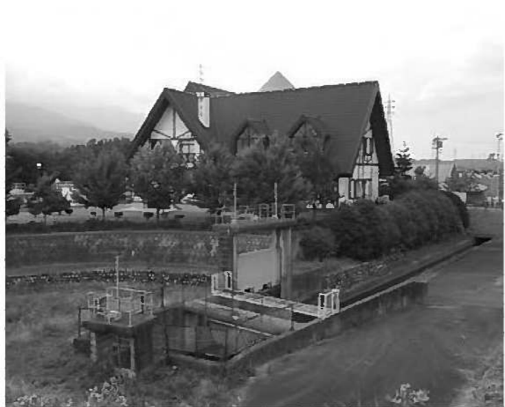
林里の下水処理施設

してくれればと理解してよいか。 村長 ケースバイケースだが充分あり得る。 質問 JＲは即対応するとしているが、水利権等難しい問題がある。トンネル内の水をポンプアップして、水源に供給することが最善策と考えるので提案しておきたい。 村長 その時は専門家がいますので、相談して一刻も早く復帰させることが大事と思う。