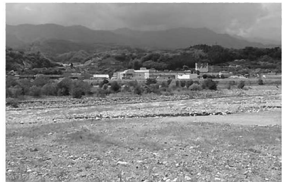
架橋が期待される建設予定地

質問 宮ヶ瀬橋着工が決まった事について下伊那北部道路問題検討委員会委員でもある課長の意見は。 産業建設課長 豊丘村の新橋について河床の変動が非常に激しいと聞く中で、河川占用許可が取れても実際の工事着工までに3〜5年かかることを覚悟した。宮ヶ瀬橋の架け替えを先に進めてもらうことが、やむを得ないものと考えた。 質問 河川占用許可を取るのに3年はかかると言われているが本当に橋は架かるのか。 村長 今後の活動が非常に重要になってくる。宮ヶ瀬橋が完成する前にこちらの調査が完了してすぐ橋が架かる状況を信じている。 質問 平成9年から3ヶ町村で架橋建設推進期成同盟会を立ち上げ運動をしてきた。今後この期成同盟会の取