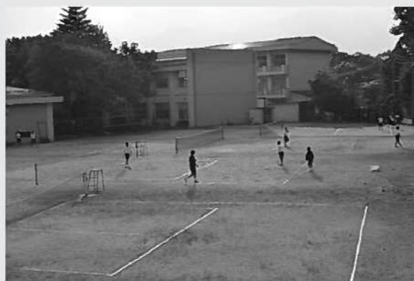
部活動運営の見直しが始まります

豊丘中学校は、本年度末まで従来どおりの形で実施し、今後実情に応じた地域連携等、来年度に向けた運営上の工夫を検討する計画。