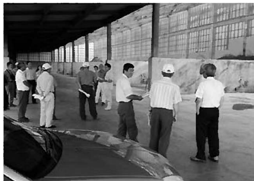
農業委員会で阿智村へ視察

質問 政府の規制改革会議があまりにも大胆な農業改革提言を打ち出した。中身は農業委員会、農業生産法人、農業協同組合の三本柱。来年の通常国会に閣連法案を提出するという報道がされている。その中の農業委員会の制度改革に関する提言