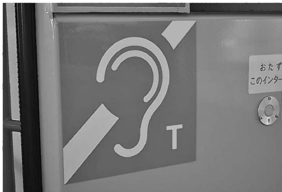
難聴者用の磁気ループ

加齢に伴う人への支援も必要。補聴器の音を聞きやすくする『磁気ループ』という音をクリアにする機械の支援を訴えた。12月の答弁では「検討させていたきたい」というも