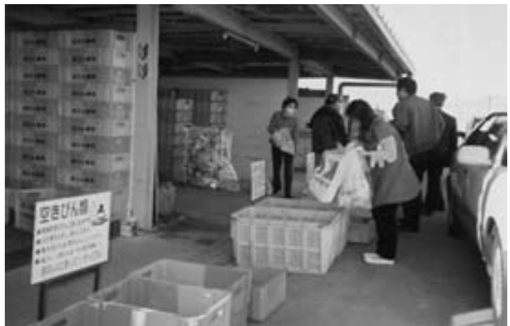
毎日ゴミリサイクル収集に取り組んでいる大木町