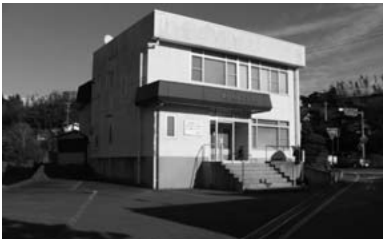
職員増員の必要性がさげられる商工会