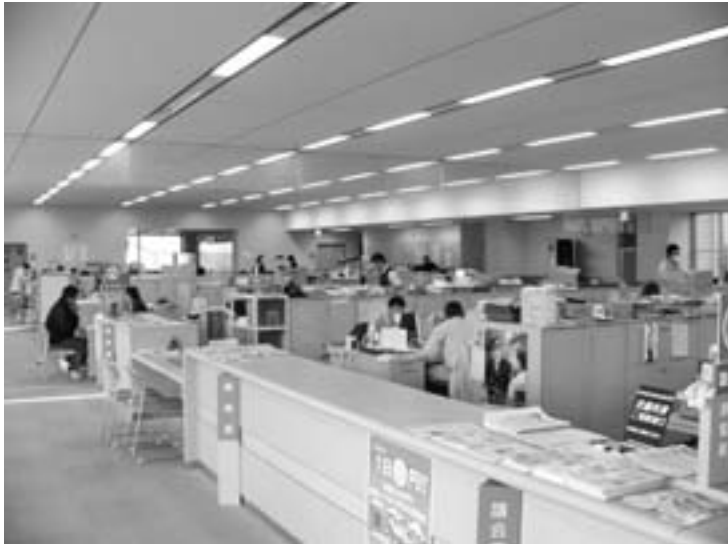
全力でがんばる役場職員