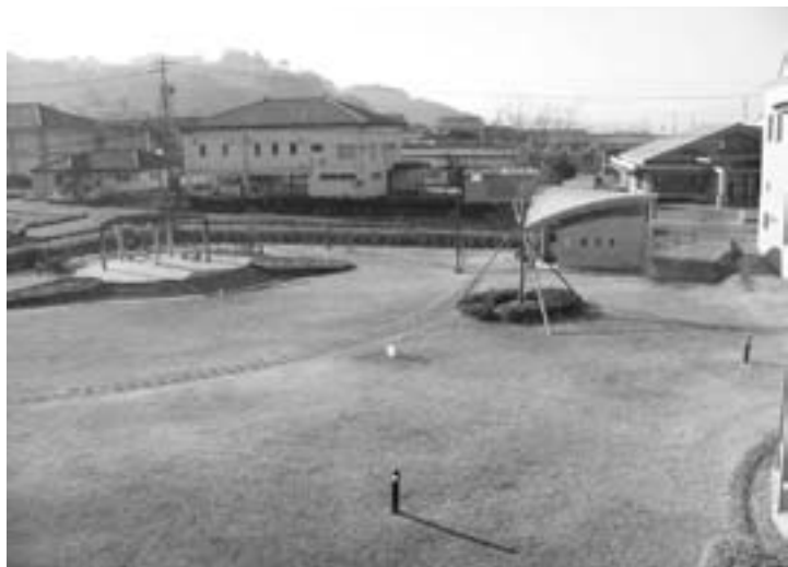
ここで良いのか!!文化施設

質問 長年の懸案である文化施設の建設について、村長は今定例会中に議会と相談して結論を出したいと発言している。現福祉センターは築後四十年余を経過する中で、老朽化による耐震性の問題、公民館活動に必要な部屋数の不足や使い勝手の悪さ等から、村の振興計画で文化活動の拠点の役割を果たせる施設の建設が盛り込まれている。具体的な建設計画を進めるためには、建設場所の確定が先決であり、「文化施設建設準備委員会」の答申では旧庁舎跡地が適当とされている。しかし、村長はこの答申を軽視し、保健センター併設あるいは建設延期を表明している。①答申を尊重するのが