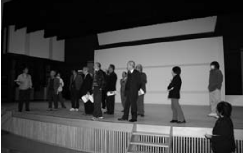
全議員で中川村の文化施設を視察(1月13日)