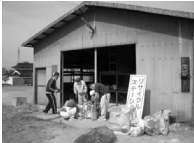
充実・強化が求められるリサイクルステーション

質問 徳島県上勝町、福岡県大木町ではゴミを減量するという考えから「ゴミを出さないまちづくり」として全国から注目されている。大木町では多分別、生ゴミの別収集