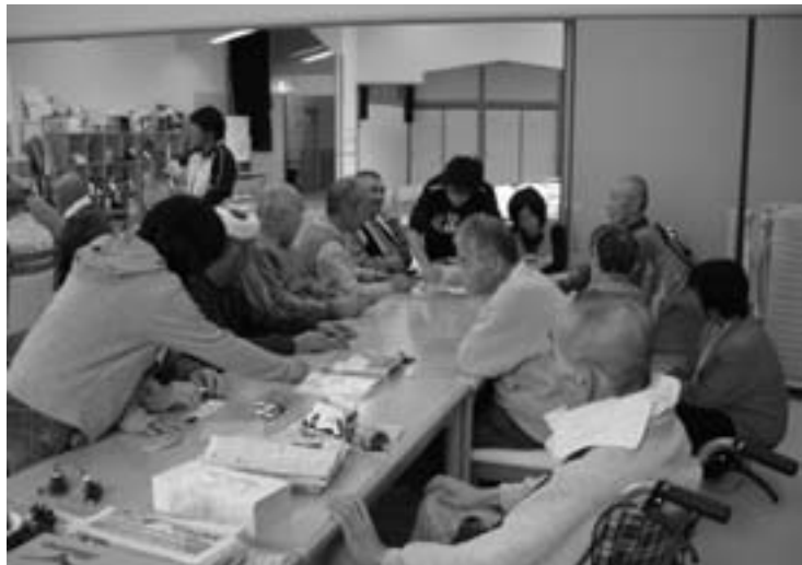
活動が生き甲斐にもつながるボランティア活動

住民課長 ポイント制度による稲城市の例については、地域で支え合う部分が必要であるが今後の課題とする。傾聴ボランティアについては保健師の補助する部分が必要ではないかと思う。活字読み上げ装置は四ヶ所に設置されているが活用されていない。有効に使う事が大事なので貸出しも検討したいと考える。