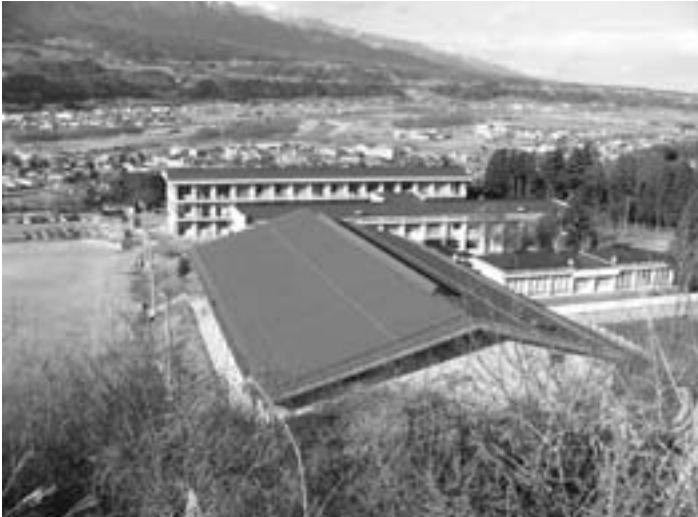
学問に打ち込める環境を