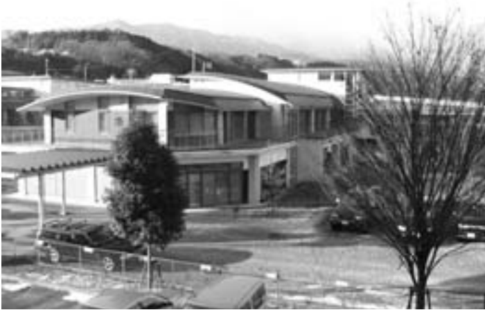
施設の不足は大きな不安材料 (写真はあさぎりの郷)

急利用には困ることもある。 質問 これからは、介護をする人の苦勞や不安の緩和をもっと考えたい。定期的に利用して自分の時間を持てるようにするなど、短期入所施設を積極的に利用できる環境づくりが、料金の軽減も含めて望まれる。 村長 施設全般にまた不足の認識は持っている。介護者が疲れない施策は必要であり、さらに実態の把握に努め、対応したい。