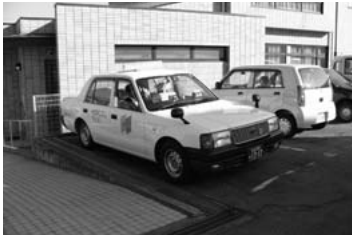
来年度の地域交通のあり方は？