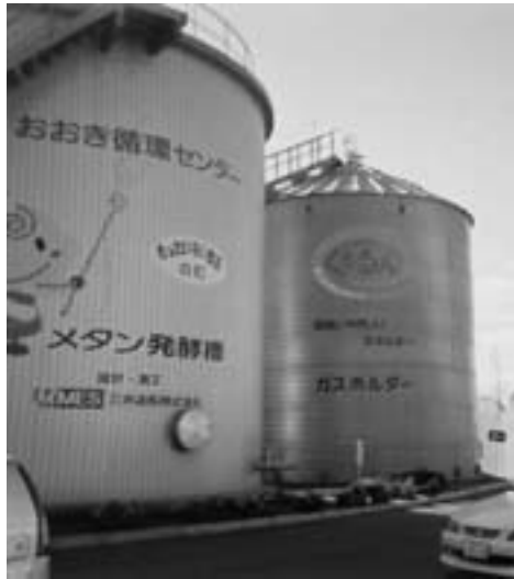
循環型のまちづくりに取り組んでいる大木町

発足までの経緯は二回にわたる住民投票は僅差で合併派が多く、時の寺谷町長はこの結果の逆の単独町政を選択し辞職した。続く町長選で合併派の町長が誕生したが、町政は混乱し財政も