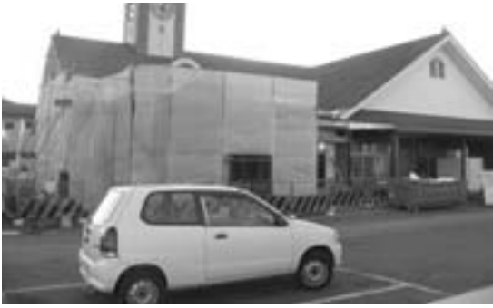
改修進む交流センター「だいち」