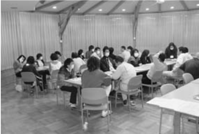
行政運営に重要な職員による政策提言

かし人勧を崩してまでの独自の給与体系は非常に危険であり人勧を遵守していく。超勤については代休対応。一年で四号昇給であるが、これについては、労使相談する中で是正していく。高齢職員についても、十六年に極端な引き下げをした経過の中で、昇給停止を外している。年二号の昇給としている。