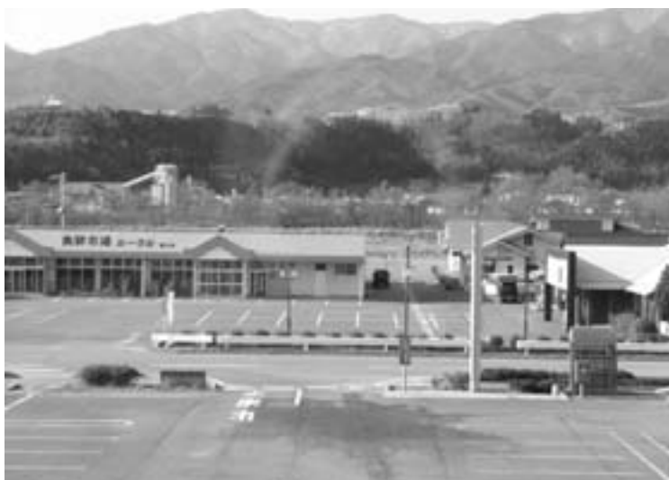
ルーラル撤退で淋しさを増す「たむらんど」

高齢者世帯訪問を行いたい。保健師、看護師五人体制で健康相談、福祉相談、保健指導等行っている。 質問 はつらつの利用状況について。 住民課長 高齢者の閉じこもり予防、介護予防の目的で現在の登録者百二十名である。利用料は一回千円。送迎があり、一日健康チェックやレクリエーション、入浴等で楽しんでもらっている。