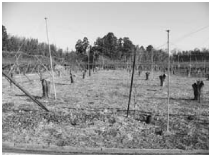
荒廃地化をどう止める？

今までに多くの議員の方からも質問が出され、私も農家の一人として農業経営は厳しく大変である。私も議員と