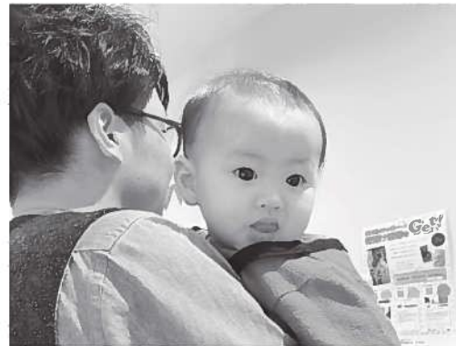
8年4月1日生まれで支給されることとなった給付金

質問 国民一人あたり一律10万円の特別定額給付金は、基準日4月27日の住民基本台帳登録者が対象だった。それ以後に生まれるため事業の対象にならない村内の新生児は、年度内に何人になるか。 健康福祉課長 今年度の新生児で基準日の4月27日までに生まれた子は4名で給付を受けた。4月28日以降に生まれた子は、9月1日時点で17名。今後今年度中に出生予定の子は2名であり、給付を受けられない子は45名との予測である。 質問 今年の7月27日に内閣府から事務連絡「新型コロナウイルス感染症対策にかかわる子ども子育て支援事業関連事業について」が出ている。今回回の第2次補正予算に盛り込まれた地方創生臨時交付金による子育て支援