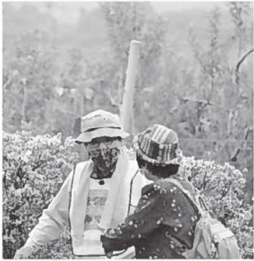
模擬訓練 おじさんどこから来たの？ 是は大丈夫？

質問 新型コロナウイルス感染症防止のため心身共に過酷な日常に耐え半年以上になる。高齢者の人たちがどんな状況に置かれているのか心配である。各地区での行事等もほとんど中止となり近くの人たちの顔すら見ることも少ない。村民のこれらはどうあるべきか。 村長 飯田下伊那からはこのところ感染者はひとりも出ていない。先週の日曜日に伴野区では敬老会を行いました。しっかりと予防 質問 新型コロナウイルス感染症をとり行い大変盛り上がり良かったと思ふ。今の状況の中、様子を見ながら勇氣を持って豊丘の中で動いてもらいたい。 質問 コロナ感染防止の中、高齢者訪問事業をどう取り組んだのか。またどんな声がかれたのか。そして高齢者のひとり暮らし世帯数、2人以上の高齢者世帯数を聞く。 健康福祉課長 コロナウイルス感染防止に十分留意しながら通常どおり実施した。電話