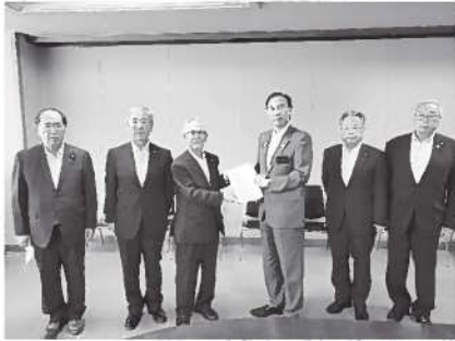
本年は5町村議長が代表して提言

8月6日開催の研修会で議論しまとめた国・県に対する要望事項等について、9月21日に県知事と県議会に提出しました。 当日は、5町村の議長が代表して地元県会議員の案内のもと、副知事と担当副議長へは全項目について、教育関係は教育長へ、道路 関係は建設部長に提言書を提出しました。 その後、議会棟に移り、県議会の正副議長と関係する5人の常任委員長に、分担して説明と提言を行いました。 この提言は、開会中の9月県議会で審議されます。