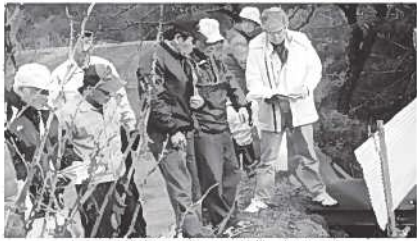
土木行政推進には地区との連携、極めて重要

質問 土木申請の方法や改善点については、令和3年度に向けて検討がされて来たところか。 答 検討課題を踏まえ、今までの土木申請説明会や区長会等で、地区関係者に改善、変更内容の提示等がされてきたと思う。 質問 村側が提示している改善、変更の内容や、地区関係者の意見、要望については、あわせて12月に行われている理事者、議会が、各地区関係者の説明のもとで行われている土木申請簡素化説明会や予算査定前の議会の審査についての考えを伺う。 産業建設課長 今までは、以前の土木懇談会や区長会で、今後の土木申請