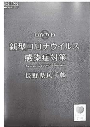
活用し、感染症対策の県民手帳

する事務など事前にある程度決めておき、状況によって選択しながら、住民サービスへの提供に支障のないように取り組む。 質問 複数人の感染拡大が発生した場合などは、自宅待機や入院などが考えられ、職員不在状況では職務の停滞を心配するが、対策はどのようにしているか。 総務課長 入院している職員には無理である