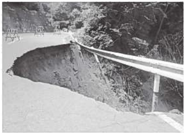
7月豪雨で崩落した広域農道

質問 トンネル掘削工事で想定される急な減水、濁水に対する緊急措置や補償など、村としての対応方針は、 総務課長 JR東海が「環境影響評価書」で「減水や濁水が生じた場合に適切な対策や対応を講じる」とし、それをもつて村は約束されているものと認識。福島区の地元の不安心に対応してJR東海と地元との協議が始まった。具体的な対策が固まった時点で文書として明文化を予定。虹川以南全線の協定の予定はない。意見、苗吹市では、知識や交渉力を持たない住民が交渉を迫られ、補償された井戸が濁れ、でも交渉期間後として、感じられなかった。南木曾町が昨年8月に交わした協定書では、県の水環境保全条例に基づき、専門委員会を設置し、具体的な