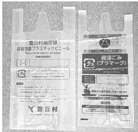
ひとまわり小さい飯田市の27リットル収集袋との比較

のあり方についてご意見や、要望を伺ってきたい。申請の簡素化の要望や、申請箇所の説明等は、関係者に大きな負担となっているとの意見を聞いている。 これらことから、今年度から現地調査は実施しない方向で進める。また、近隣町村でも予算査定前段での議会の審査は行われておらず、今後議会へ提案させていただきます。