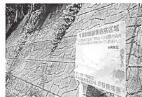
県施行の急傾斜地崩壊危険区域対策工事

し、住宅等の新規立地の規制や既存住宅の移転促進等のソフト事業が目的。この区域内の方が新たに警戒区域以外に住宅を新築される場合には国・県・村の補助がある。人家の上だとか、その下の斜面等における直接的対策は、現在の補助制度上では厳しい。一歩交通の安全対策は、道路防災事業として可能と思われ。根本的な警戒区域の解消を村が直接実施することは、制度上では難しい。当面の雨水排水対策では、公共の排水が問題であれば地区からの通報で調査・修繕を実施している。斜面の巨木が起因での崩落は、斜面の巨木は所有者との協議をする中、何らかの対策は必要と思う。 また、特別警戒区域内の住宅移転の計画がありましたら、ぜひご相談いただきたい。