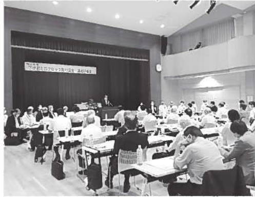
全体研修会の様子

毎年、恒例になっている研修会を8月6日に「ゆめあるて」で開催しました。当日は、コロナ感染予防のため規模を縮小し、各町村の提言議題について、3分科会に分かれ検討し、次のとおり決定しました。 総務・教育分科会 ① W E B会議、テレワークの推進や、学校へのICT支援など、コロナ禍を契機にオンラインの推進策 ② 各地で増加している「空き家」改修事業の