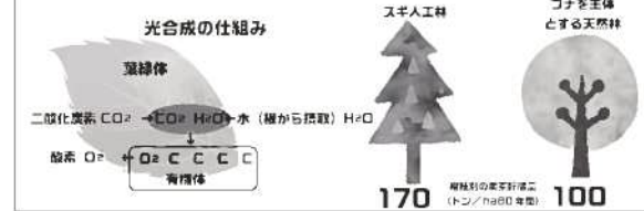
林野庁編集「知ってほしい森と木のこと〜2010〜」より抜粋

森林の地球温暖化防止機能 樹木は光合成により、大気中の二酸化炭素を吸収し、酸素を放出しながら炭素を貯え成長します。樹種や林齢によって異なりますが、例えば適切に手入れされている8.0年生のスギ人工林は1ha当たり約170トン、ブナを主体とする天然林は1ha当たり約100トンの炭素を貯蔵していると推定されます。