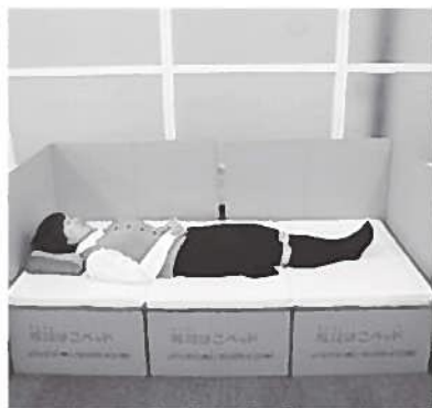
段ボールベッドの一例

質問 社会福祉協議会を窓口としたボランティア受け付け体制の準備はできているか。コロナの体制に入ったことを前提にしての答えを。 健康福祉課長 コロナを前提とした窓口というのはいまだ設定はしていません。 提案 避難の練習をやってみたらどうか。例えば保健センターの2階の一角にスペースの展示をして、村民の皆さんに体験してもらおうというように、本町の災害時のイメージトレーニングは大切だ。知っているのと行動の差がでてくる。段ボールの間仕切り、段ボールのベッドはこんなもんですよ