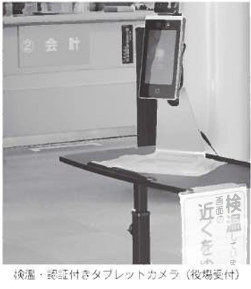
検温・認証付きタブレットカメラ (後場受付)

問 公共土木工事の半分が設計監督委託費で金額が高いのでは、 答 概算設計算出方式による単価設定が高めだが、予算執行で精査する。 問 災害復旧、土橋修繕等、土木工事が200箇所以上ある。 答 災害支援は3年間ある。期間内に村内業者を中心に行っていく。