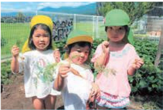
にんじん採れたよ！