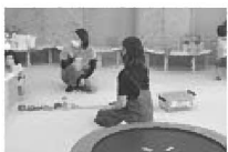
遊びに来たお父さん 達が子どもの話や 家族の話をして楽し く過ごしています。