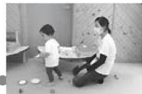
ママごと用のお皿を1枚 ずつ運んであそぶ子ど もを宥げるお父さん。