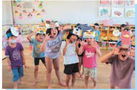
お獅子だー！ガオーー！