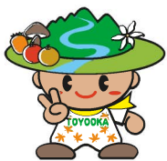
豊丘村キャラクター 「だんQくん」