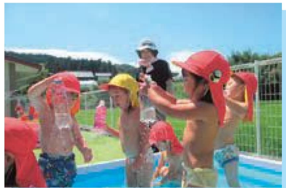
みて〜！シャワーだぞー！