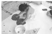
小さなプールに1人ずつ入って ピチャピチャ、たのしいね!