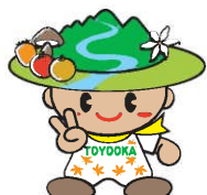
豊丘村キャラクター 「だんＱくん」