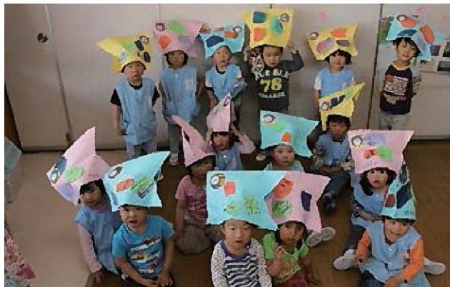
☆鯉のぼり作ったよ♪