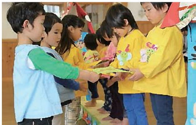
☆ハッピーバースデートゥーユー♪♪