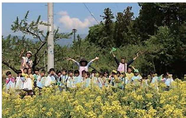
☆菜の花畑ではいチーズ！！