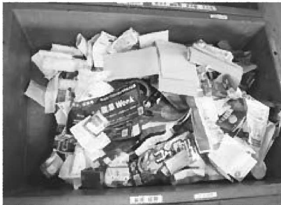
資源 紙類 紙製容器・雑紙