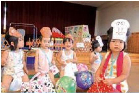
お祭りたのしいな！