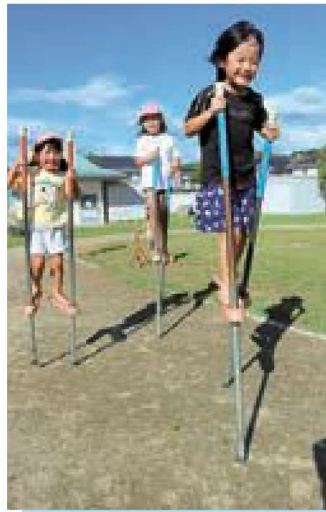
たけうま上手でしょ？☆