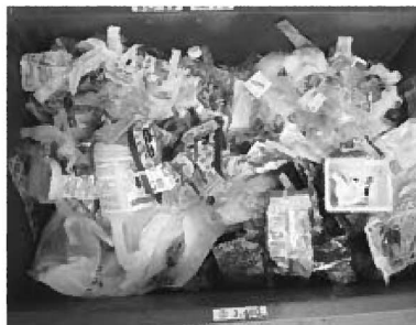
資源プラ 容器包装プラスチックビニール

令和3年度のごみチェックと比べ、資源となる紙が多くみられました。また、埋立ごみ（アルミカップ）や有害ごみ（ララ使い捨てカミソリ、金物類（目玉クリップ）の混入が少量ありました。燃やすごみは年々増加傾向にあり、逆に資源ごみの引き取りは減少傾向にあります。資源ごみの分別と燃やすごみの減量に引き続きご協力をお願いします。