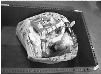
破袋して中身のチェックをします。紙製容器（アイスの箱）が見えます。