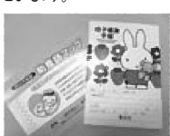
豊丘村のかわいい母子手帳

昨年度までは母子手帳を随時発行していましたが、妊娠期からの切れ目ない支援を行うために令和4年度からは妊婦教室を開き、教室にて母子手帳を交付する取り組みを保健衛生係で行っています。子育て支援係も妊娠期の皆さまとの繋がりを大切にしたいという思いから、妊婦教室に同席しています。