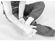
足の指が動く事が大切です

かわいいお友だちが集まって、親子広場「ココベビークラス」を行いました。今回は、上沢先生を講師にお迎えして「ヒラテイス」を行いました。自分の体と向き合いながら、先生の指導のもと、産後の体の調整を自分のペースで行いました。