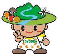
豊丘村キャラクター 「だんQくん」