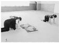
お腹を締めて背中を真っ直ぐに