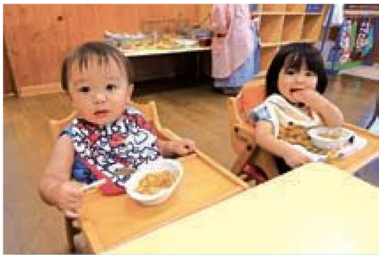
モリモリ食べるよ♡