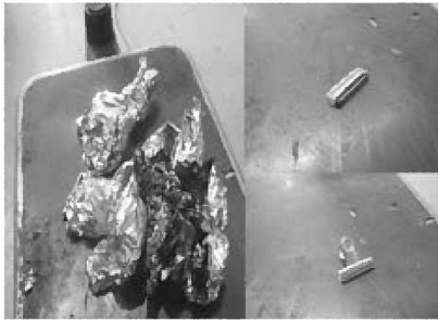
不適切物 埋立ごみ・有害ごみ・金物類

今回のごみチェックでは、資源になる紙類がたくさん入っていました! 再資源化できるものがないか、燃やすごみを見直してみよう!