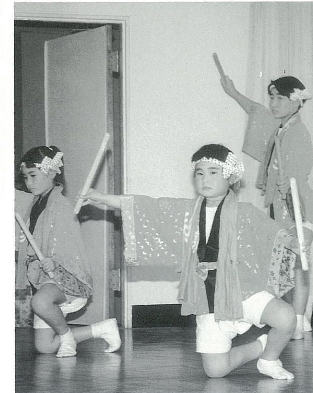
とよおか祭りの発表会