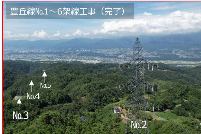
豊丘線No.1~6架線工事 (完了)