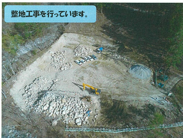
整地工事を行っています。