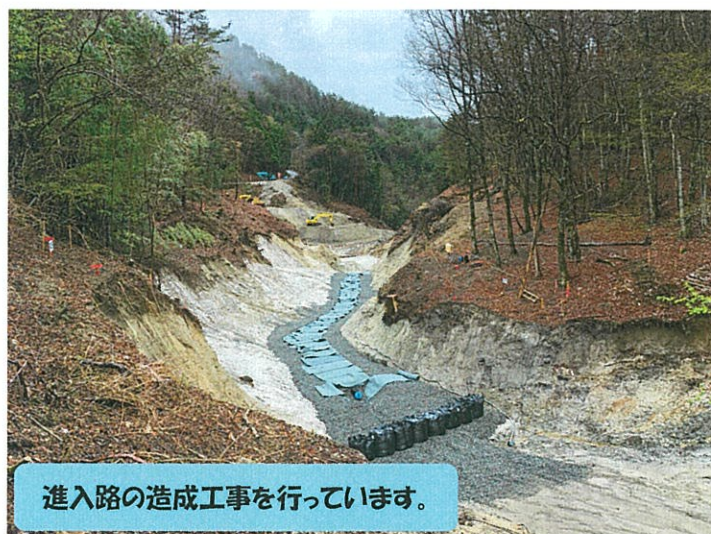
進入路の造成工事を行っています。

現在トンネルヤード整備工事、発生土置き場造成工事等を実施しておりますが、今後トンネルの掘削開始に向けて工事車両の運行が多くなります。工事車両は右写真のステッカーを掲示し、決められた搬入ルートを通行させて頂きます。安全運転を最優先とし、運転マナーに十分配慮し通行いたします。