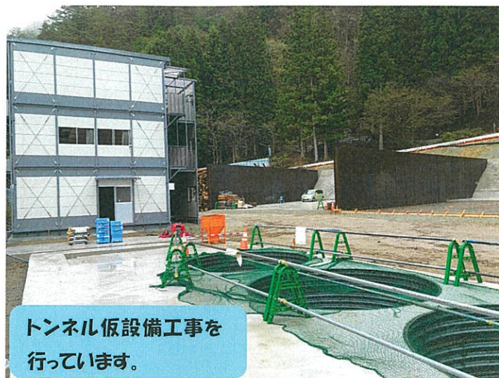
トンネル仮設備工事を行っています。