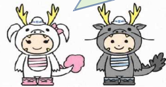
リュウコ リュウタ 飛島・市川工務店工事共同企業体 イメージキャラクター