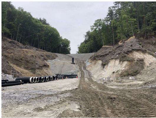
① 全景写真 (上流部)