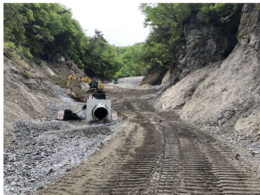
④ 地下排水工 (中流部)