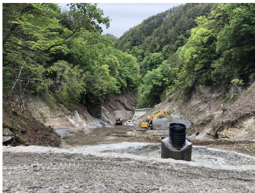
③ 全景写真 (中流部)