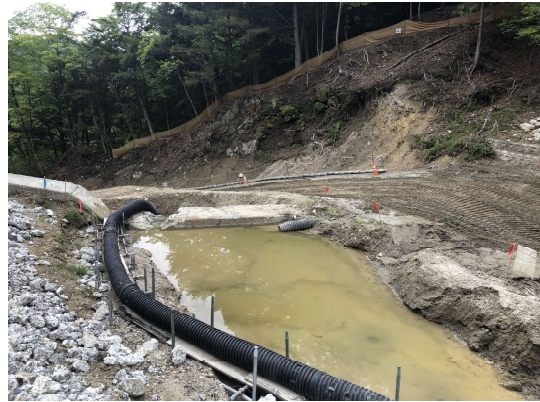
② 仮設沈砂池 (中流部)