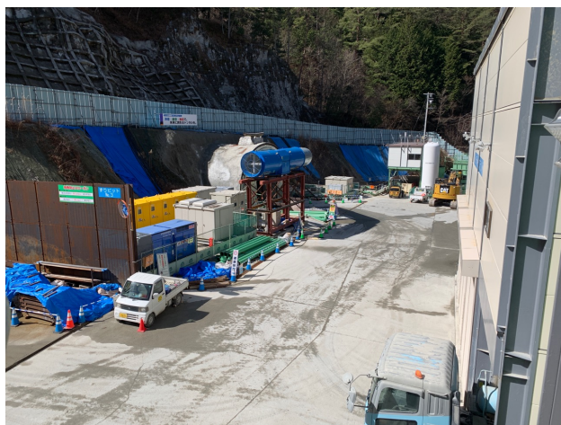
坂島非常口ヤード