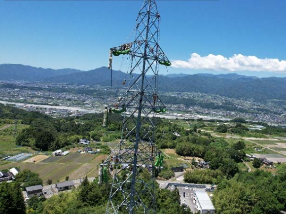
豊丘線No.6～No.10間架線工事中