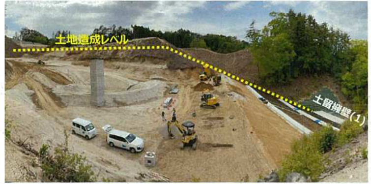
写真④ 変電所ヤード 盛土状況