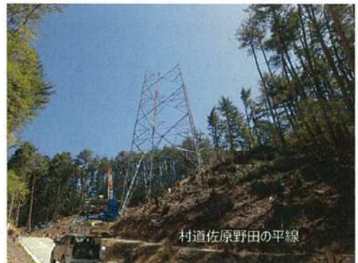
村道佐原野田の平線