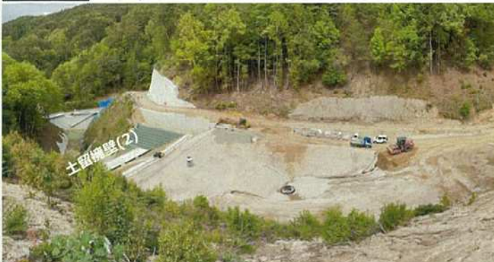
写真③ 搬入道路 盛土状況