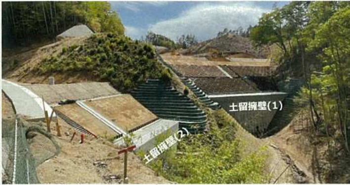
写真② 土留擁壁上部 盛土状況